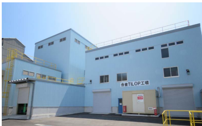
合金T I L O P専用工場